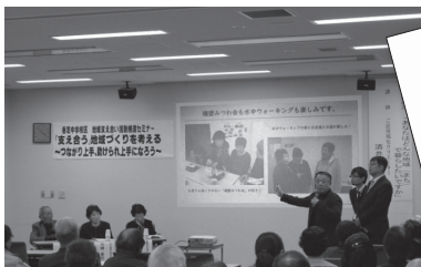
中学校区支え合い活動推進セミナー 令和2年1月17日(金)