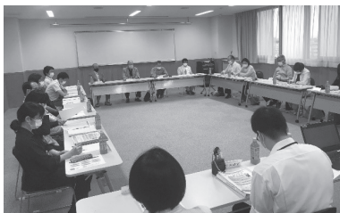
わがまち香芝ささえ愛会議 令和3年6月16日(水)